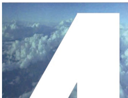
8 NADIA HOTAIT Cielos robados. 2015 Vídeo-instalación.